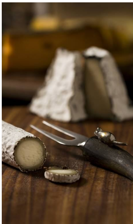
Queijo de cabra produzido em Joanópolis, São Paulo

RIO - Após o almoço, as cabras fazem a sesta ao som de uma playlist de música lounge — as canções de Bebel Gilberto e Norah Jones são as mais tocadas. Lá pelas 16h, hits da banda Jota Quest embalam a segunda ordenha do dia (a primeira costuma ser na parte da manhã, no mesmo ritmo). À noite, o rádio é desligado: depois do último “béeee”, os animais dormem com o barulhinho dos grilos e sapos que habitam o Capril DeVille, em Secretário, na Região Serrana do Rio.