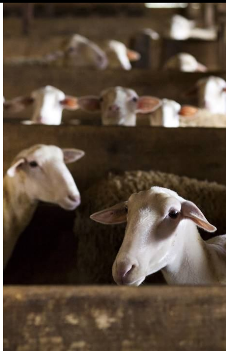
Ovelhas do Sítio Solidão

chamado Quinta da Pena, daí vem o nome dos nossos queijos — conta Mônica. — O meu apelido é Pena, pois sempre fui muito pequena e muito magra, meus filhos me jogavam para o alto. Então, diante daquele portão em Setúbal, pensei: “Se algum dia sair um queijo dessa brincadeira, ele vai se chamar Quinta da Pena.”